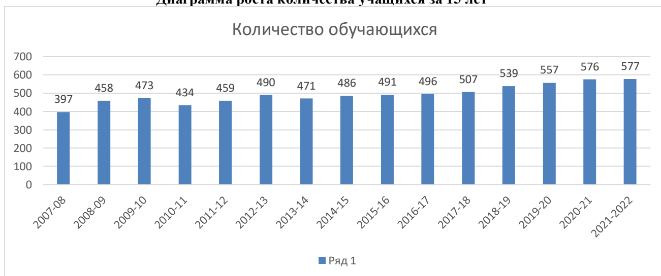
Диаграмма роста количества учащихся за 15 лет

Идет тенденция к увеличению контингента обучающихся.