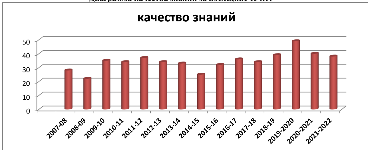
Статистика показателей за 2017–2022 годы