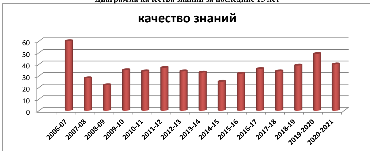
Статистика показателей за 2016–2021 годы