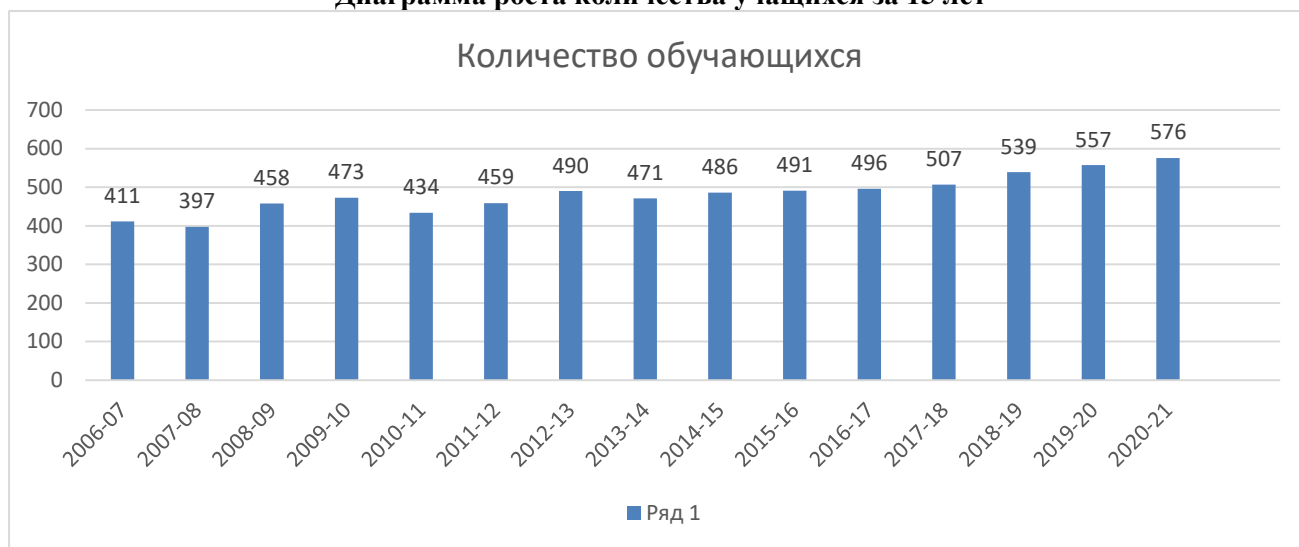
Диаграмма роста количества учащихся за 15 лет

Идет тенденция к увеличению контингента обучающихся.