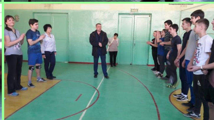
выступление юнармейцев перед обучающимися начальной школы,