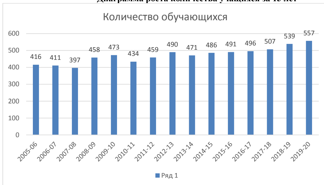
Диаграмма роста количества учащихся за 15 лет